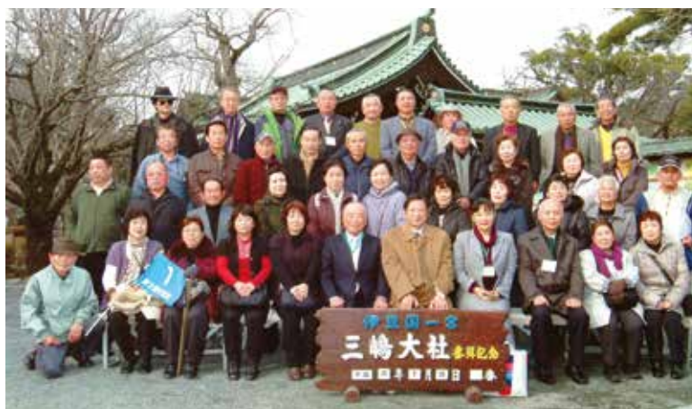
ふくの後援会新春の集い(1号車)